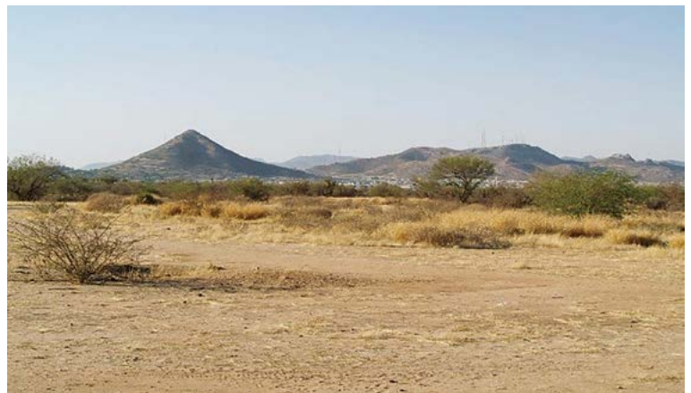
Figura 3. Fraccionamiento Mallorca, zona sur de la ciudad de Hermosillo, Sonora, México.